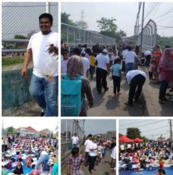
Gambar 2. Gerakan resik-resik sampah bukti kesadaran lingkungan bersama Pempes dan kepala desa randupitu

Melalui program Bank Sampah, masyarakat Dusun Babat menjadi lebih sadar akan masalah lingkungan dan belajar bagaimana menangani sampah dengan benar. Sosialisasi yang dilakukan oleh pemuda setempat berhasil mengubah persepsi masyarakat tentang pentingnya pengelolaan sampah. Hal ini ditunjukkan dengan adanya gerakan peduli sampah bersama Pempes dan perangkat desa bahkan dipimpin langsung kepala desa randupitu seusai adanya gelaran Café Rider setiap hari minggu yang diadakan desa randupitu untuk mengangkat ekonomi UMKM dan setelahnya diadakan bersih-bersih sampah plastik yang berserakan disamping jalan.