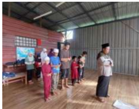
Gambar 4 Pelaksanaan Sholat Dhuha

Kegiatan pembelajaran di SB Kampung Gamut dimulai pukul 09.00-12.00 kemudian dilanjutkan pada pukul 18.30-20.00 setiap hari senin-sabtu. Mengajarkan mengaji dan sholat dilakukan dari puku 09.00- 12.00, sedangkan calistung diajarkan pada pukul 18.30-20.00. Adapun jadwal kegiatan dapat dilihat pada tabel 1. Kegiatan diawali dengan berdoa bersama dan dilanjutkan dengan menyanyikan lagu Indonesia raya serta melafalkan bacaan surah pendek. Selain itu juga dilakukan sholat dhuha berjamaah sebelum kegiatan dilaksanakan.