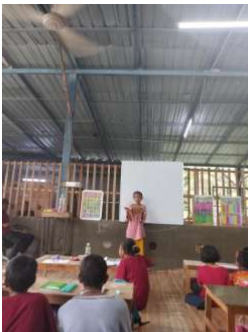
Gambar 2 Pelaksanaan Program Membaca

Sebelum dilakukan program Calistung, anak-anak diberikan tes untuk mengukur kemampuan membaca, menulis dan menghitung. Berdasarkan hasil pre-test didapatkan kemampuan calistung anak-anak masih tergolong kurang bagus, dimana sekitar 17 anak belum mengenal abjad, dan sekitar 5 anak belum bisa membaca kalimat dengan lancar. Kemudian anak diajarkan secara terpisah dan dibagi menjadi dua kelas, yaitu kelas 1 untuk anak-anak yang belum mengenal abjad dan kelas 3 untuk anak-anak membaca cerita dan menyambung kata.