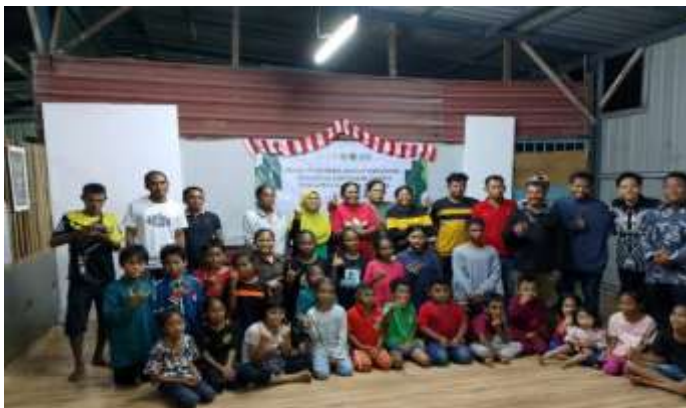
Gambar 1 Sosialisasi Program Calistung

Setelah mendapatkan informasi terkait tempat dan kondisi anak-anak di sana, kegiatan selanjutnya adalah melakukan sosialisasi terkait program yang akan dilaksanakan selama kegiatan KKN berlangsung, sehingga pengurus maupun anak-anak SB Kampung Gumut paham dengan program yang akan dilaksanakan.