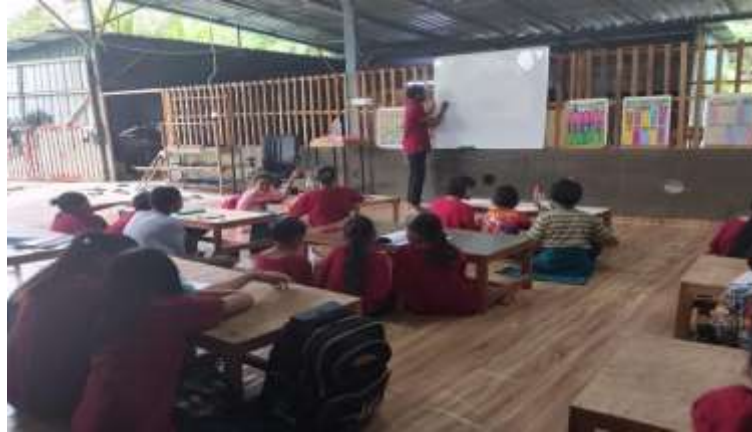
Gambar 5 Pelaksanaan Kegiatan Menulis di Kelas

3. Anak-anak dikelas 1 diajarkan menulis huruf abjad dan menulis huruf hijjayah. Sedangkan anak-anak kelas 3 diajarkan menulis kalimat dan bacaan surah pendek. Selain itu anak-anak juga diajarkan melukis sehingga pelajaran yang dilakukan menjadi tidak membosankan.