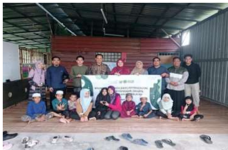
Gambar 6 Kegiatan Evaluasi Program bersama Dosen

Monitoring dan evaluasi dilakukan untuk mengetahui perkembangan pelaksanaan kegiatan, dan menilai kesesuaian kegiatan yang telah dilaksanakan dengan perencanaan. Evaluator dapat juga berfungsi sebagai motivator bagi mahasiswa KKN, pengurus SB dan masyarakat dalam meningkatkan kemampuan belajar membaca menulis dan berhitung pada anak-anak di SB Kampung Gumut.