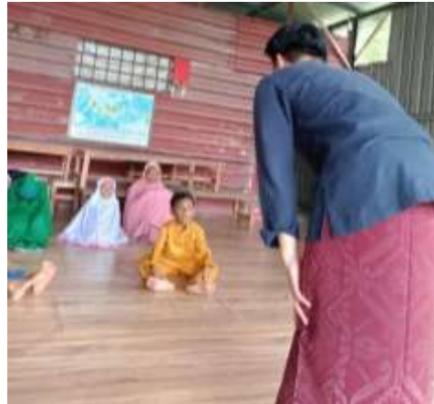
Gambar 3 Mengajarkan Sholat

Anak-anak juga diajarkan melaksanakan sholat dengan benar. Anak-anak diajarkan cara mengambil wudhu, bacaan sholat dan bagaimana cara melakukan sholat dengan benar. Pembelajaran dilakukan dengan cara memberikan contoh langsung kepada anak-anak, setelah diberikan contoh anak-anak diminta untuk dapat menirukan contoh yang telah diberikan. Anak-anak PMI juga diajarkan mengumandangkan adzan, sehingga diharapkan anak-anak tersebut mampu menjadi anak-anak yang beriman dan bertaqwa.